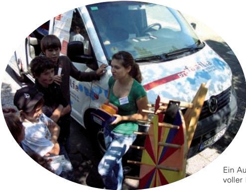
Ein Auto - voller Informationen

Von Montag bis Donnerstag steht außerdem das Lovemobil von Pro Familia vor dem „Waldhaus“. Es soll Jugendliche motivieren, sich mit ihrer persönlichen Lebenssituation, ihrem Heranwachsen und ihrer Zukunftsplanung auseinander zu setzen.